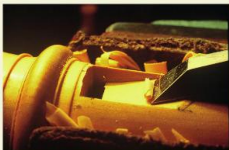
Taille du biseau