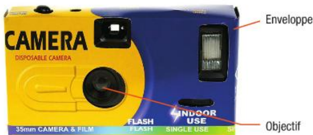
Un appareil photo jetable.

b Précisez si ces matières premières sont renouvelables ou non.