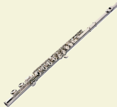
Flûte traversière en métal