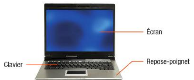
Un ordinateur portable.