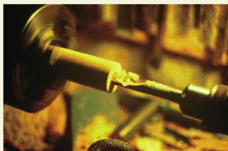
Alésage du corps