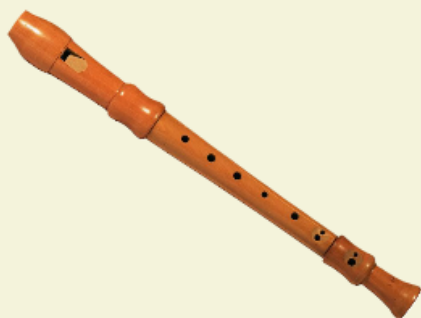
Flûte à bec en bois

Malgré les avantages qu'il présente, le plastique ne saurait remplacer le matériau naturel qu'est le bois. En effet, aucun plastique ne possède les propriétés sonores du bois ni sa capacité à absorber l'humidité du souffle.