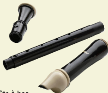
Flûte à bec en matière plastique