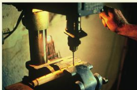
Perçage des trous