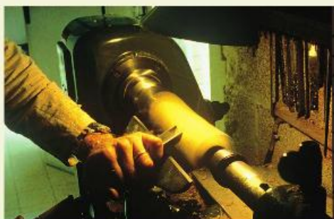
Chaque morceau de bois est arrondi au tour à bois